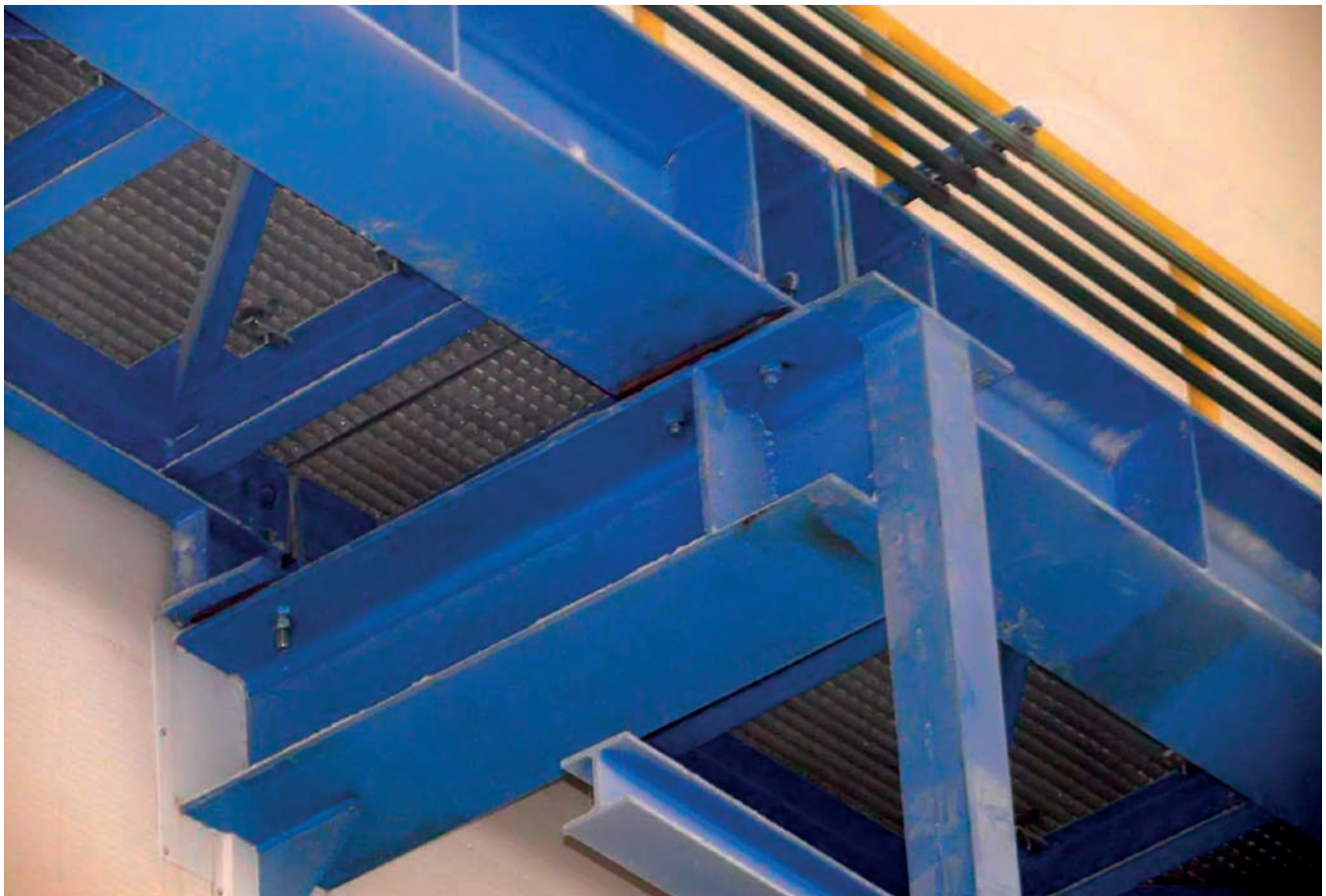
Obr. 3 – Chybná rektifikace jeřábové dráhy