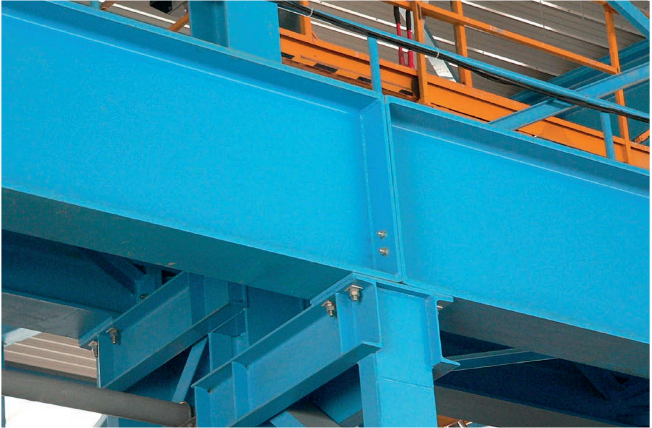
Obr. 2 – Uložení jeřábové dráhy bez rektifikace