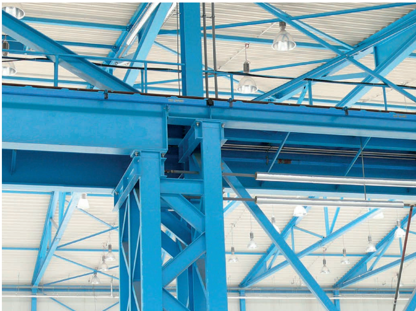
Obr. 4 – Nevhodné řešení styku drah o různých rozpětích

Rektifikace kolmo na dráhu v tomto uložení (obr. 3) byla zajištěna pouze oválnými otvory v konzole. Reakce jeřábu se přenášela až na okraj konzoly sloupu (reakce nebyla koncentrována k ose sloupu), takže docházelo k jejímu výraznému kroucení. Jeřáb s relativně velkým rozpětím měl značné reakce od přičení mostu a obě větve dráhy od sebe roztlačoval. Výsledkem byla potřeba častých rektifikací a problémy s nákolky. Dráha samotná navíc byla relativně měkká (i když splňovala požadavky normy na průhyb), takže v ložisku docházelo praskání přípojných šroubů.